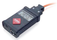
传感器通信装置 SC 参见页码 18